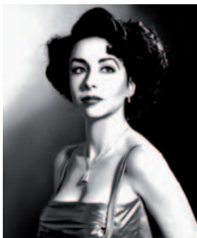
© Sebla Selin Ok, Being Star, Elizabeth . Tirage argentique noir et blanc, 50 x 70 cm, 2008.

« Ces femmes qui courent avec les loups (acte 2) » | Exposition „Die mit den Wölfen rennen (2. Akt)“ | Ausstellung 15.01 → 21.03.2010