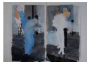
© Cigdem Menteshoglu, Untitled / the cycle of Monologue 2008, huiles sur toile, 150 x 106 cm.

« Made in Connotation* » Cigdem Menteshoglu | Exposition „Made in Connotation*“ Cigdem Menteshoglu | Ausstellung