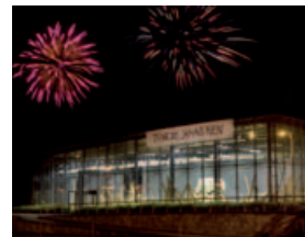
Exposition Pierre Ardouvin / Production Frac Alsace (2009) photo © Jean-Baptiste Dorner.

« L'Art est un jeu. Tant pis pour celui qui s'en fait un devoir ! » | Exposition „Die Kunst ist ein Spiel. Pech für den, der sie sich zur Pflicht macht!“ | Ausstellung 03.03 → 16.05.2010