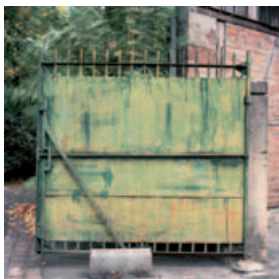
Le Portail (version accentuée)

Françoise Saur | Exposition Françoise Saur | Ausstellung 6.02 → 28.03.2010