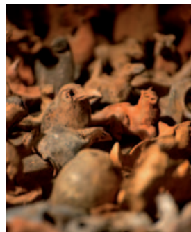
François Klein

« Hors d'œuvres et brimborions » François Klein | Exposition „Außergewöhnliche Kunstwerke und Kleinigkeiten“ François Klein | Ausstellung 12.03 → 12.05.2010