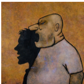
Il n'est plus l'ombre de lui-même. 1999. Huile sur toile – 80 x 80 cm, appartient à l'artiste.