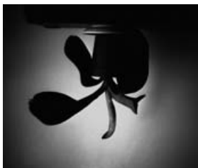
© Becky Beasley, Five revolutions , 2004 (détail). Collection Eric Franck, Londres.

« En présence » | Exposition „ In Anwesenheit “ | Ausstellung