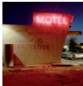
Jeff Brouws, Motel Drive , Fresno, California, 1991. Épreuve à l'encre à pigment, 45,7 x 45,7 cm. © Jeff Brouws 2006. Photo : Florian Kleinfenn.