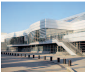
La Filature

« Le décor à l'envers » | Exposition „ Hinter dem Dekor “ | Ausstellung 5.03 → 2.05.2010