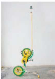
Snow - Francesco Arena, 2009

« Les sculptures meurent aussi » | Exposition „ Die Skulpturen sterben auch “ | Ausstellung 28.01 → 28.03.2010 proposée par Lorenzo Benedetti